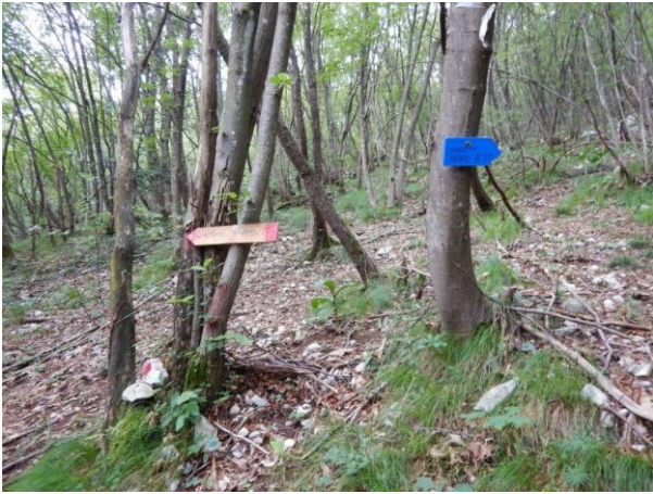
Bivio tra sentiero 3 amici e parete nord-est