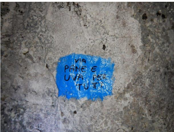
Esempio di scritta alla base della via PANE E UVA PER TUTTI