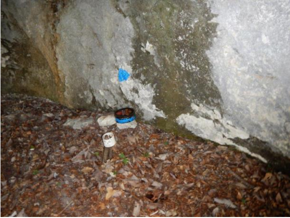
Contenitore per lasciare un commento sulle ripetizioni delle vie (nicchia prima delle corde fisse)