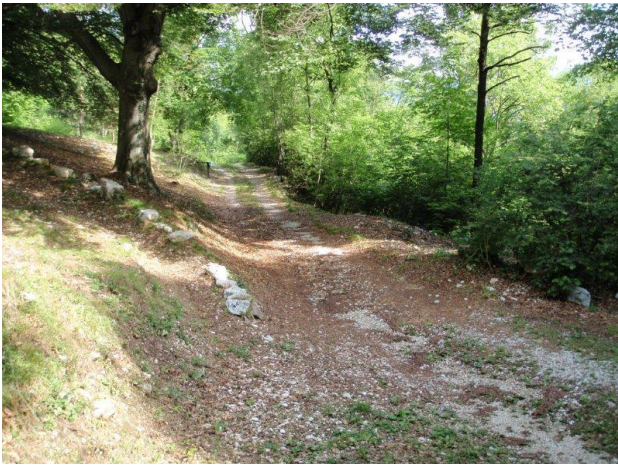
Stradina appena partiti dalla macchina