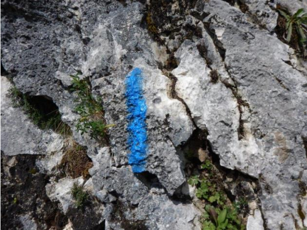
Bolli blu per arrivare alla parete nord-est.