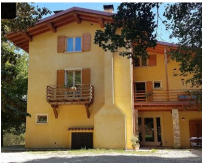
Agriturismo San Lorenzo di Persegno

Per chi volesse andare alle vie del Monte Pizzocolo sull'Avancorpo Nord-Est o Setiero Tre Amici, ricordiamo che la zona è accessibile con le macchine raggiungendo l'abitato di Navazzo. Impostare sul navigatore l'indicazione Traversa di Via Valvestino, 25084 Gargnano BS. Seguire le frecce/indicazioni per l'Agriturismo San Lorenzo di Persegno (NON METTERE SUL NAVIGATORE DIRETTAMENTE L'AGRITURISMO PERCHE' VI PORTA AVANTI NELLA VAL VESTINO E NON SI ARRIVA).