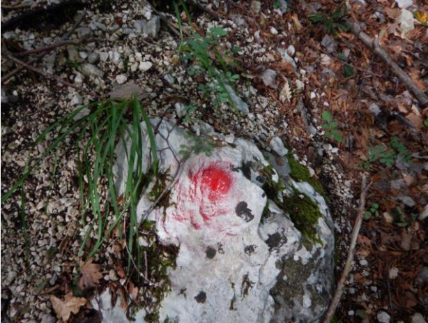
Bolli rossi del sentiero 3 amici