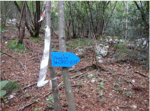
Cartello blu per la parete nord-est