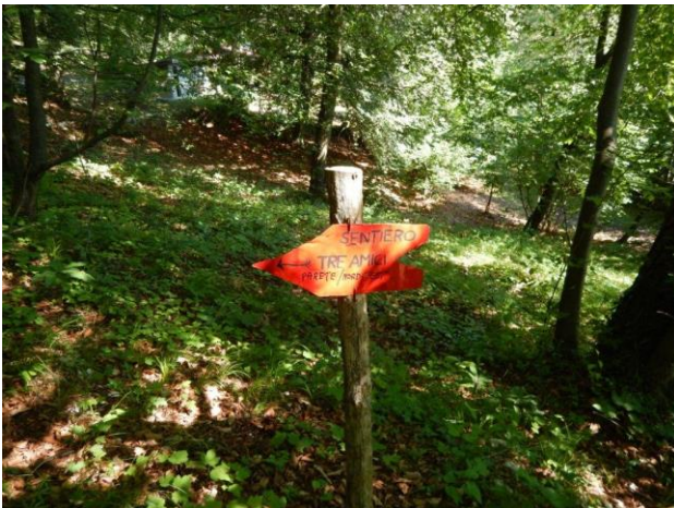
Freccia segnavia del sentiero 3 amici e parete